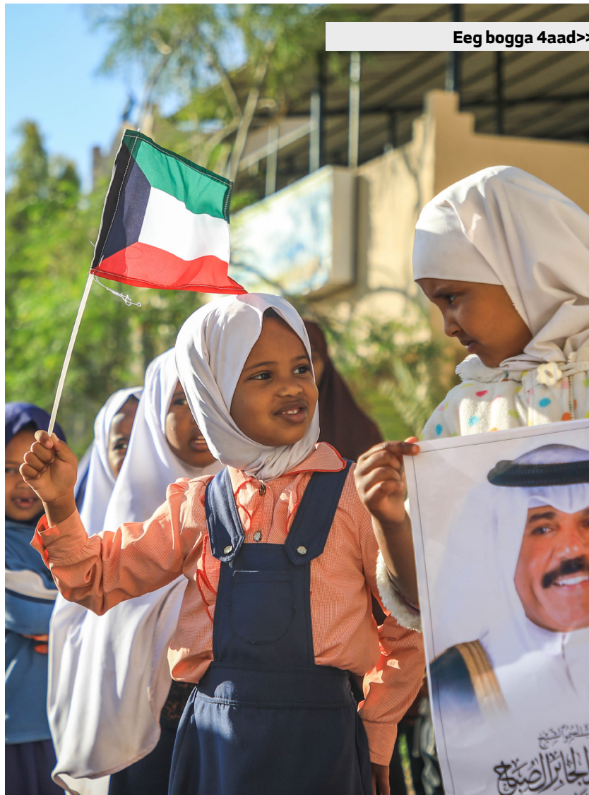
Eeg bogga 4aad>>