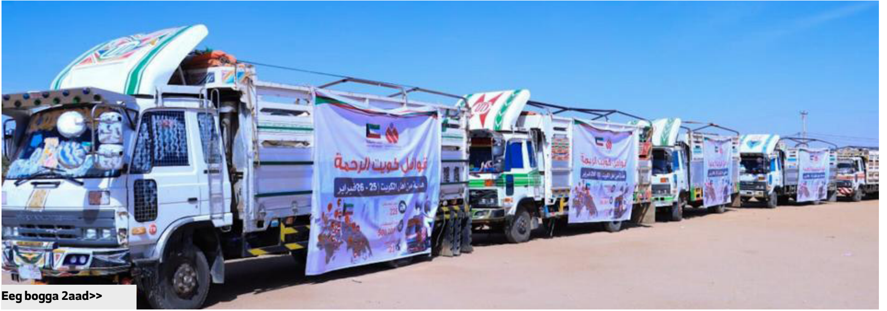
Eeg bogga 2aad>>