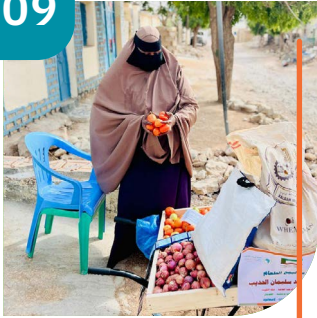
MASHAARIICDA XOOGSI XALAAL AH