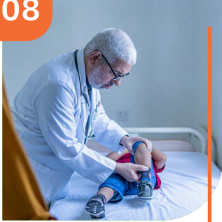
ADEEGYADA IYO HAWLAHA SAMAFAL EE CAAFIMAADKA