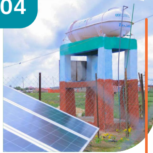
MASHAARIICDA BIYAHA IYO FAYADHOWRKA