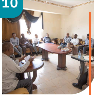
AQOON & OGAAL